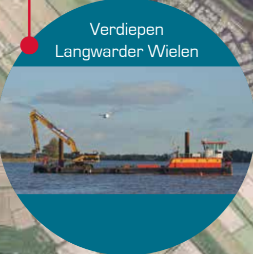
Verdiepen Langwarder Wielen